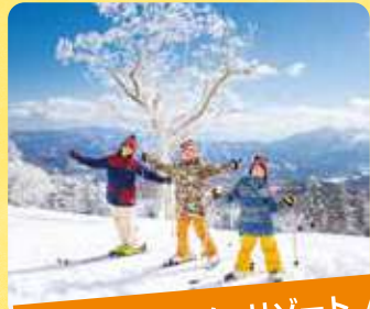
グランデコスノーリゾート リフト券

郡山市にあるレジャー施設。園内には、ドリームランド、プール(夏季のみ)やカルチャーセンターなどがあります。