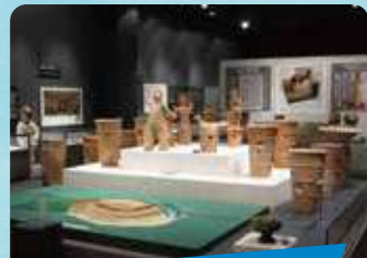
福島県立博物館 年間パスポート

北塩原村にある美術館。シュルレアリスムの巨匠サルバドール・ダリの作品において、アジア最大級の収蔵数を誇ります。