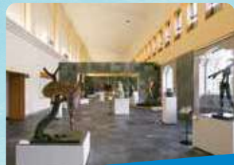
諸橋近代美術館 ミュージアムパスポート

いわき市にある東北最大級の楽しく学べる体験型水族館。潮目の海をテーマに800種を超える生物を展示しています。