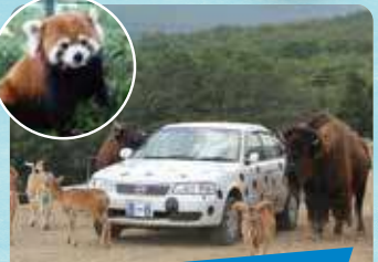
東北サファリパーク 年間パスポート

会津若松市にある県立の博物館。福島県の古代から現代までの歴史、民俗資料、自然資料を大規模に展示しています。