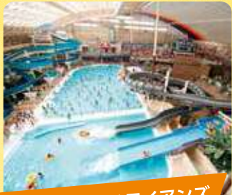
スパリゾートハワイアンズ 入場券

いわき市にある大型温水プール・温泉・ホテル・ゴルフ場からなる大型レジャー施設です。