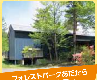
フォレストパークあだたら コテージ5人用/ 常設トレーラーサイト

裏磐梯にある、大自然に囲まれたリゾート施設。冬はパウダースノーが広がるグレンデでスキーを楽しめます。