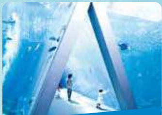
アクアマリンふくしま 年間パスポート

いわき市にある東北最大級の楽しく学べる体験型水族館。潮目の海をテーマに800種を超える生物を展示しています。