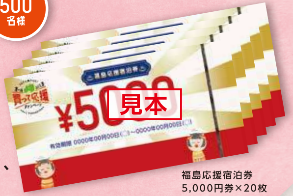
福島応援宿泊券 5,000円券×20枚

福島県は全国第4位の温泉地数! 「新しい生活様式」を取り入れながら、 温泉地めぐりをお楽しみください!